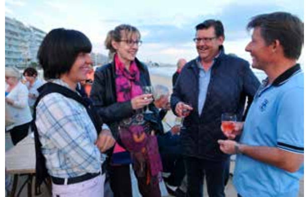
A la bonne vôtre les amis...

C'est à nouveau au restaurant les Canetons, sur la plage de La Baule, que sera lancée officiellement, le mercredi 31 mai, la 9 e édition du National UJSF de Golf.