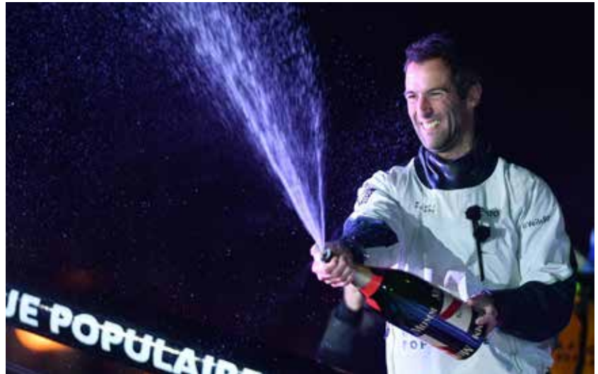
Première sur les greens de St-Denac pour Armel Le Cléac'h, vainqueur du Vendée Globe en janvier.