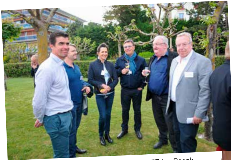
Un apéritif très apprécié sur les pelouses de l'Eden Beach