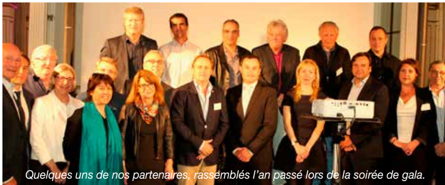
Quelques uns de nos partenaires, rassemblés l'an passé lors de la soirée de gala.

Une quarantaine de partenaires nous soutiennent dans l'organisation de ce National UJSF de Golf des Journalistes. Sans eux, nous ne pourrions mettre sur pied cette manifestation. L'UJSF Ouest et le Club de la Presse sportive de l'Ouest tiennent à leur rendre hommage et leur adressent leurs plus sincères remerciements. Nous citerons :