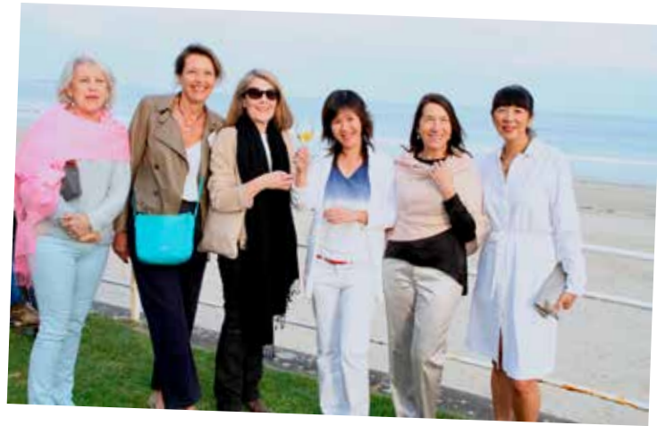
A la bonne vôtre Mesdames...