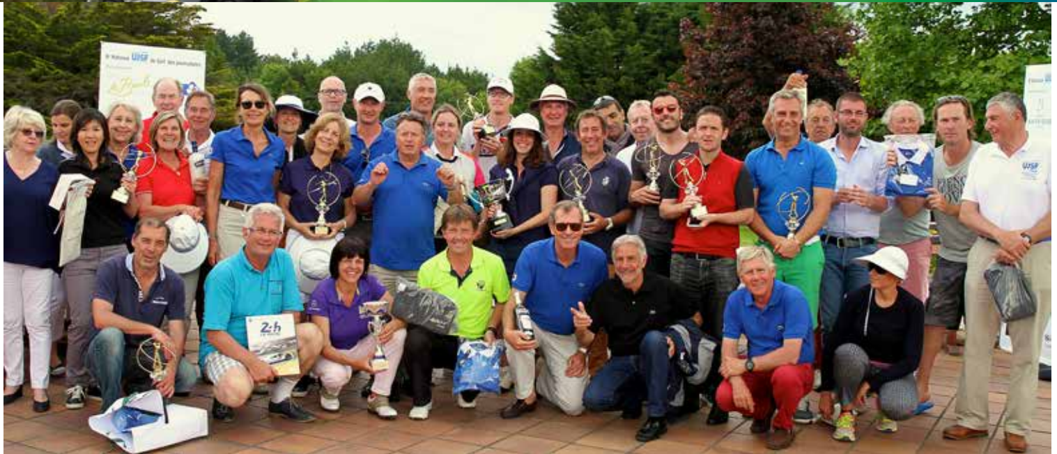
Photo de famille pour les lauréats de cette 8 e édition...