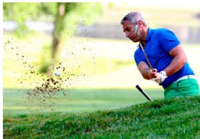
Le rugbyman Yann Delaigue dans ses œuvres.