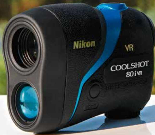
COOLSHOT 80i VR

LE PREMIER TÉLÉMÈTRE LASER À RÉDUCTION DE VIBRATION OPTIQUE*