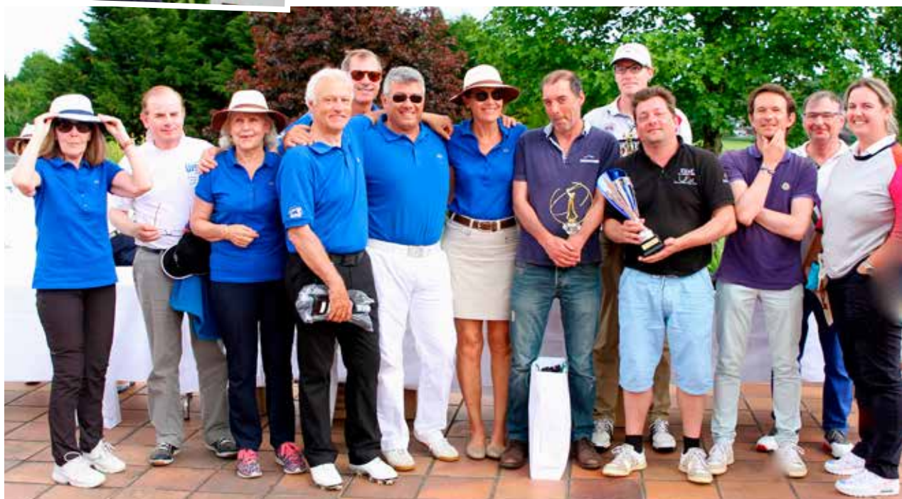
Toujours très disputé le challenge par équipe. Il est revenu en 2016 à France Télévisions