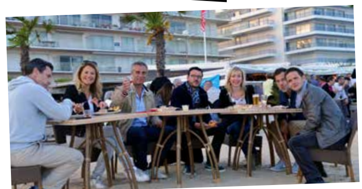
Conférence de rédaction entre BFM TV et Canal+