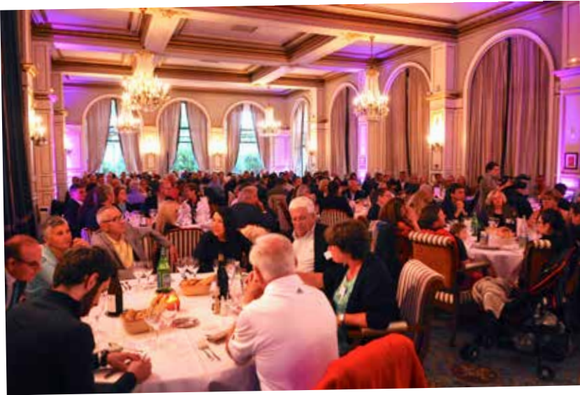
Près de 200 personnes avaient pris place dans le salon « Ambassadeurs » de l'Hôtel Hermitage.