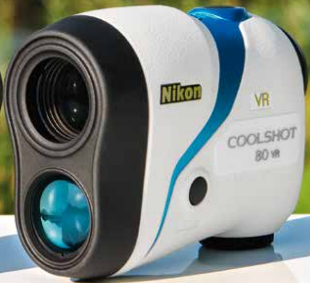
COOLSHOT 80 VR